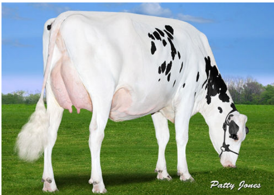
CLAYNOOK COLITA BOMBERO FOURTH DAM